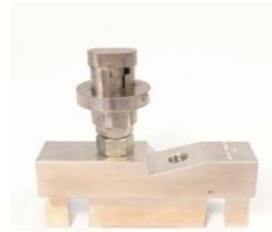
外車用固定アダプター